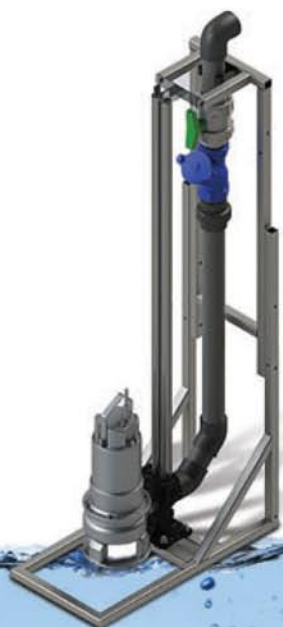
KIT REGARD SIMPLE POMPE