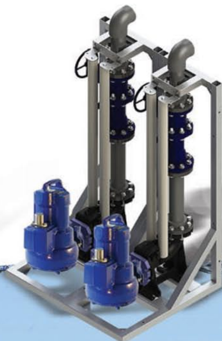
KIT REGARD DOUBLE POMPES