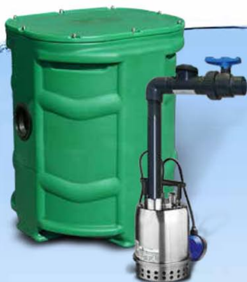
SANIDRAIN 250 VERSION KIT DE CONNEXION