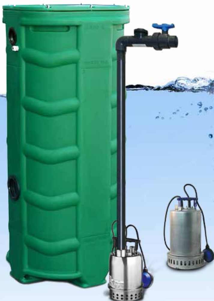
SANIDRAIN 500V VERSION KIT DE CONNEXION