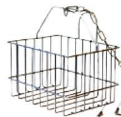
Panier de dégrillage (option)