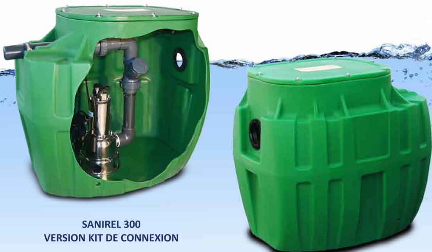
SANIREL 300 VERSION KIT DE CONNEXION