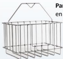
Panier de dégrillage en option