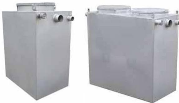
Appareils présentés avec couvercle(s) inox en option

Le choix de la taille du séparateur est fonction du nombre de repas servis par jour. Un séparateur de graisses doit être vidangé régulièrement, généralement tous les 2 mois. Pour le choix du modèle consultez notre bureau d'études.