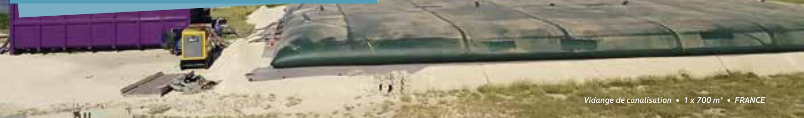
Vidange de canalisation • 1 x 700 m 3 • FRANCE

Comment être certain que votre installation sera 100% conforme ?