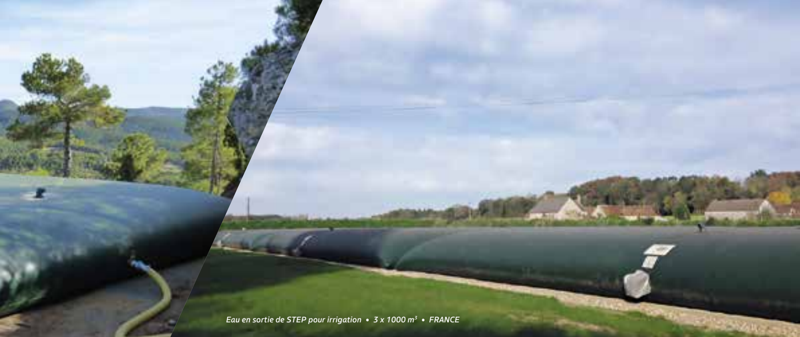
Eau en sortie de STEP pour irrigation • 3 x 1000 m 3 • FRANCE